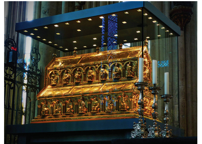
Ковчег с мощами волхвов в Кельнском соборе

Позже мощи переправили в Европу, и сейчас они хранятся в Кельнском соборе в Германии.