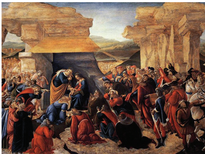
Сандро Боттичелли. «Поклонение волхвов» (ок. 1475)

Волхвы направились в Вифлеем и, к их радости, путеводная звезда остановилась над местом, где родился Христос.