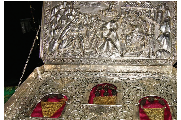
Дары волхвов в монастыре святого Павла (Афон)

Цитируется по публикации пользователя «Живого журнала» Leagnoff