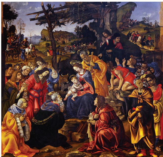
Филиппино Липпи. «Поклонение волхвов» (ок. 1445)

Позже стали появляться легенды о загадочных звездочетах. Впервые имена волхвов – Каспар, Мельхиор и Бальтазар – появились на мозаике в церкви Сант-Аполлинаре-Нуово в Равенне.