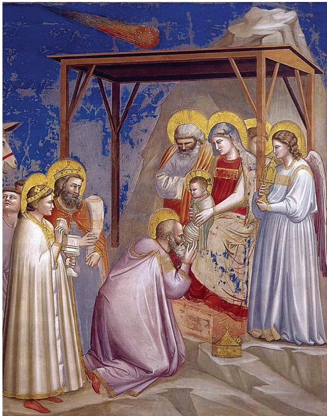
Джотто ди Бондоне «Поклонение волхвов» (1304–1306). Фреска капеллы дель Арена, Падуя

РОЖДЕСТВО ХРИСТОВО... ОБЫЧНО В ПРЕДДВЕРИИ ПРАЗДНИКА В МУЗЕЯХ И ХРАМАХ ЛЮДИ ЛЮБУЮТСЯ ИЗОБРАЖЕНИЯМИ СЦЕН РОЖДЕСТВА ХРИСТОВА НА КАРТИНАХ, ИКОНАХ И В ВЕРТЕПАХ. МЛАДЕНЕЦ ЛЕЖИТ В КРОВАТКЕ, А К НЕМУ С ПОКЛОНОМ ИДУТ ВОЛХВЫ С ДАРАМИ. НО НЕ В ЭТОМ ГОДУ... В ЭТОМ ГОДУ НАМ ОСТАЕТСЯ ЛИШЬ ЛЮБОВАТЬСЯ РЕПРОДУКЦИЯМИ ПРОИЗВЕДЕНИЙ ВЕЛИКИХ ХУДОЖНИКОВ ПРОШЛОГО. И ПРОИЗВЕДЕНИЙ ЭТИХ, К СЧАСТЬЮ, НЕМАЛО. И ВСЕ-ТАКИ, КТО ТАКИЕ ВОЛХВЫ, И ЧТО СИМВОЛИЗИРУЮТ ИХ ДАРЫ?