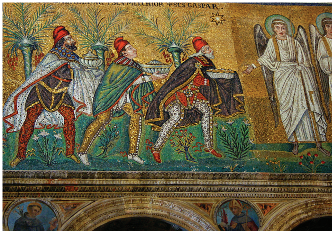
Фрагмент мозаики с именами волхвов в Равенне

Дары волхвов одно время также находились в Константинополе в храме Святой Софии. Но в XV веке, когда город захватили турки, дочь сербского князя перевезла дары в афонский монастырь святого Павла.